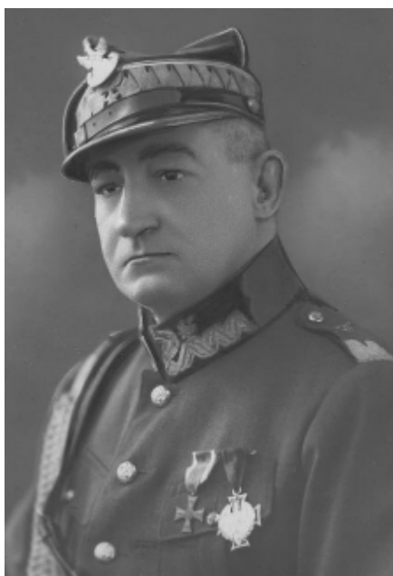
Figure 1. Prof. Ireneusz Wierzejewski. Sign. 1-W-620-1

Rycina 1. Prof. Ireneusz Wierzejewski. Sygnatura 1-W-620-1